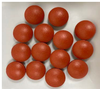
图 1: 薄膜包衣的维生素C片