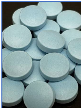
图 1: 包衣片