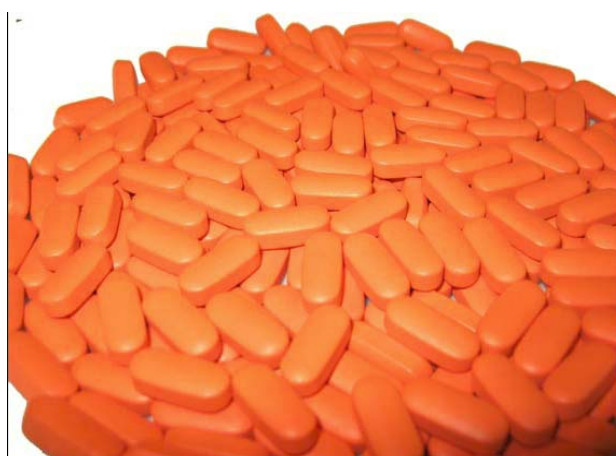
图3.连续包衣模式下从出片处取的包衣片

在这两种模式下(批处理模式或连续模式)，包衣所得片剂的外观都是好的，包衣片的颜色均匀，包衣片面没有任何的缺陷(图3)。